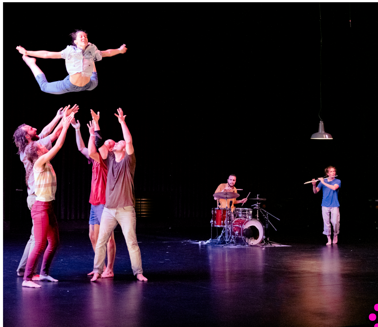
C'est ça aussi @ Lucas Dubuis

Nous pensons que les cultures travaillent au bénéfice de la société dans son ensemble, elles nourrissent un écosystème global qui ne trouve et fonde sa résilience et sa force que dans le tissu de relations finement tissées, dans la diversité des domaines, des parcours, des visions et des savoir-faire. Nous sommes ainsi convaincu-es que les cultures sont essentielles, qu'elles sont des garantes de nos identités collectives, qu'elles sont créatrices de liens, de confiance et d'engagement en société, et donc qu'elles renforcent la citoyenneté. Pour les professionnel·les comme pour les amateur·rices, elles permettent de prendre sa place dans l'espace public et d'ainsi le rendre un petit peu plus habitable. Audacieuses, mouvantes et rassembleuses, elles questionnent le passé, le présent et le