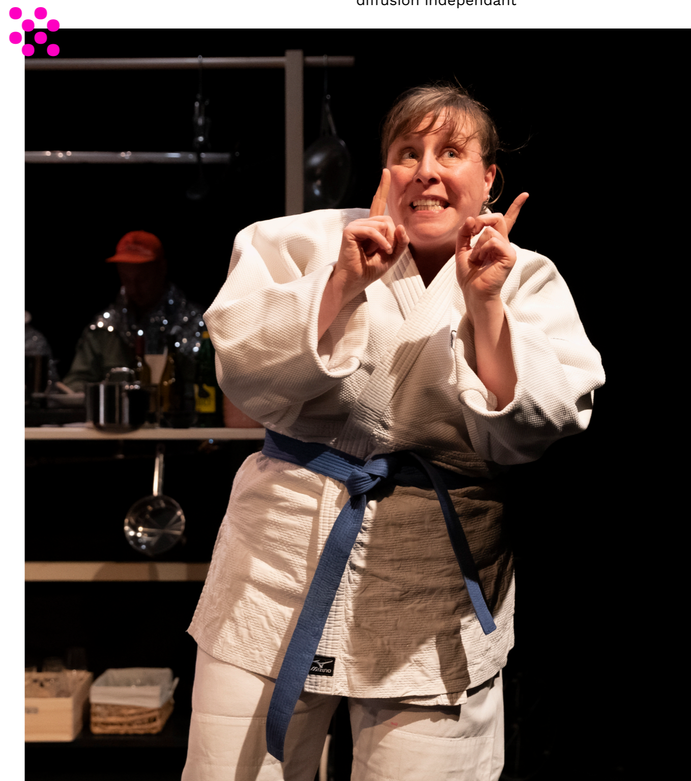
J'ai faim d'amour, mais je pense que ça va être plus simple de me faire des pâtes