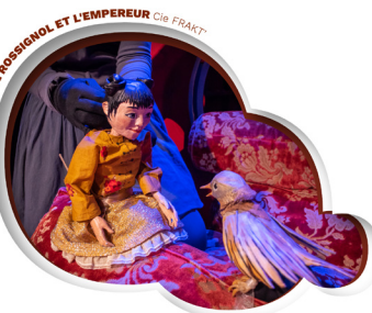
LE ROSSIGNOL ET L'EMPEREUR Cie FRAKT