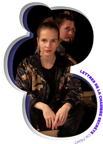
LETTRES DE LA CHAMBRE SECRÈTE Cie FRAKT